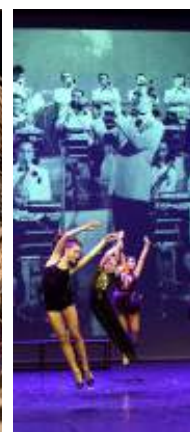
2ÈME ÉDITION : FESTIVAL BULB !